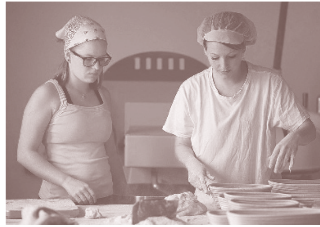
In die Handlung des anderen hineinfinden