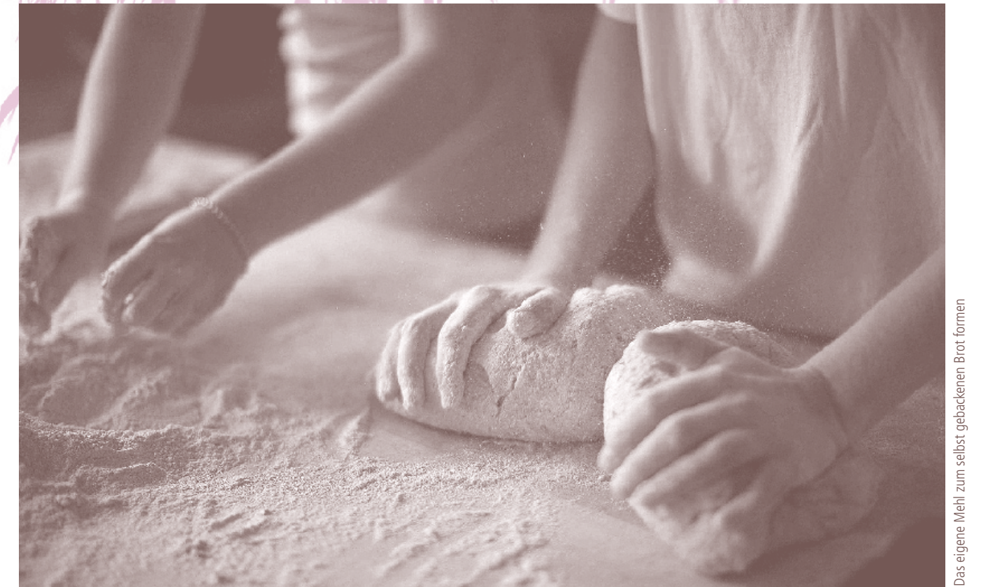
Das eigene Mehl zum selbst gebackenen Brot formen